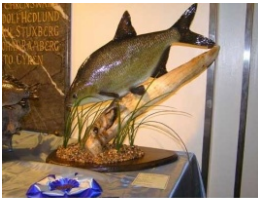
Lövängens Zoologiska Montage