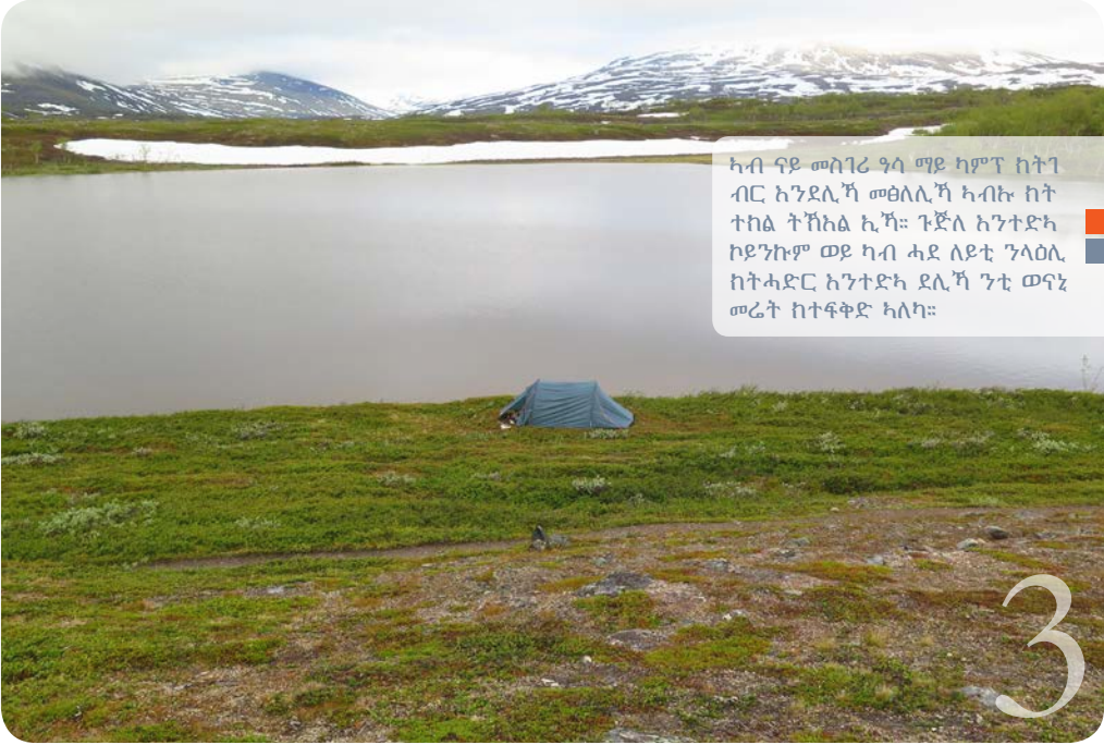
ኣብ ናይ መስገሪ ግሳ ማይ ካምፕ ክትገብር ኣንደሊኻ መጸለሊኻ ኣብኡ ክትተክል ትኽከል ኪኻ። ጉድለ ኣንተድኣ ኮይንኩም ወይ ካብ ሓይ ለይቲ ንላዕሊ ክትሓድር ኣንተድኣ ደሊኻ ንቲ ወናኒ መሬት ክትፍቅድ ኣለካ።

ኣብ ተመሳሳሊ ዝኸነ ቦታ ንኹሎ ሰብ ዘተኣናግድ ቦታ ተዘይሃልዩ ኣብቲ ከባቢ ቀዲሙ ዝበጸሐ ሰብ ቀዲሙ የሰግር። ካልኦት መሰገርቲ ኣኽብር ከምኡ ድማ ምስ ካልኦት ኣስገርቲ ዘለካ ርሕቆት ሓሉ።