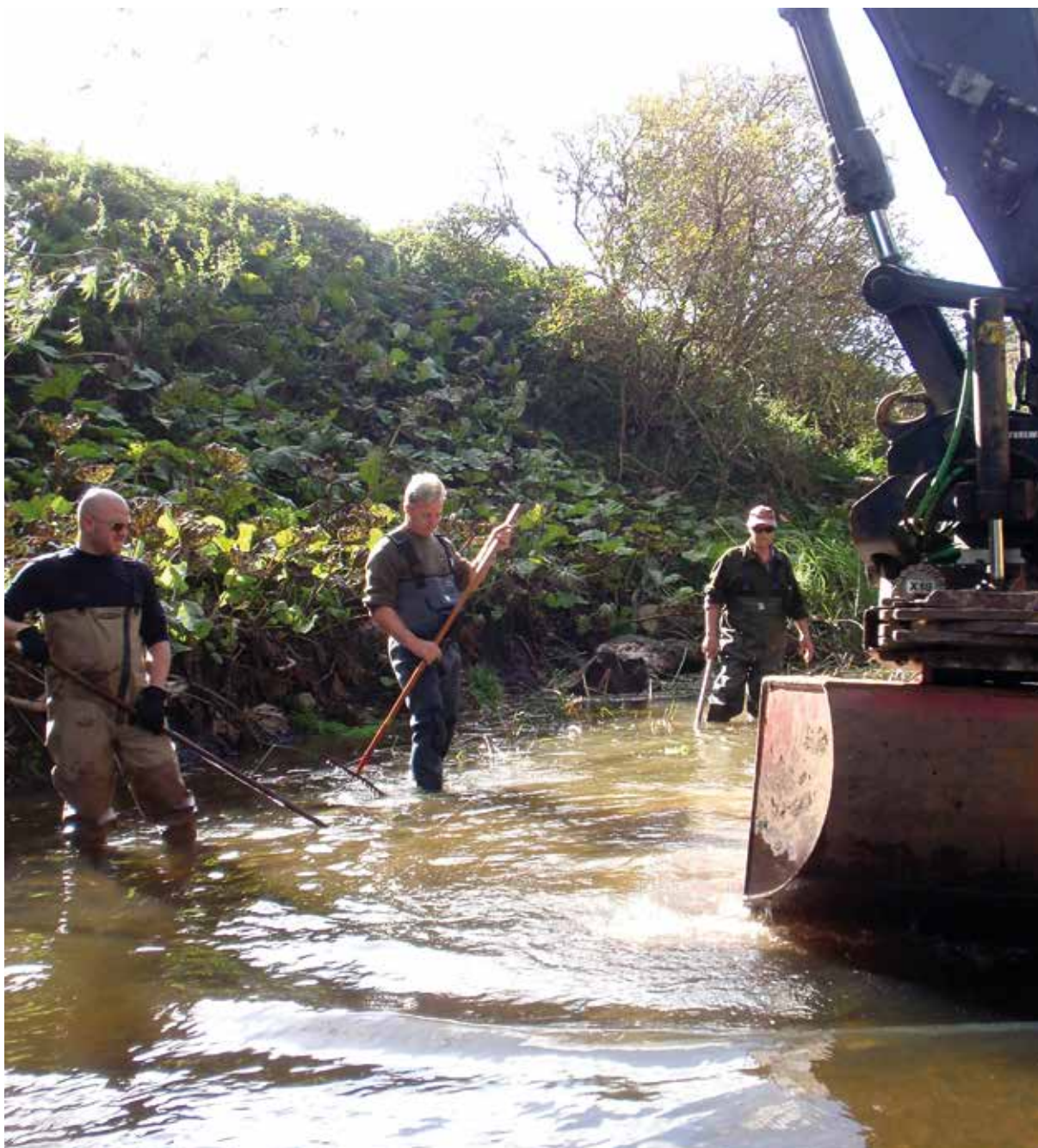
Lokalkännedom och engagemang för sitt närområde är grundläggande komponenter när det kommer till fiskevård. Sportfiskarna tycker därför att det är viktigt att stödja de ideella krafter som finns ute i landet.