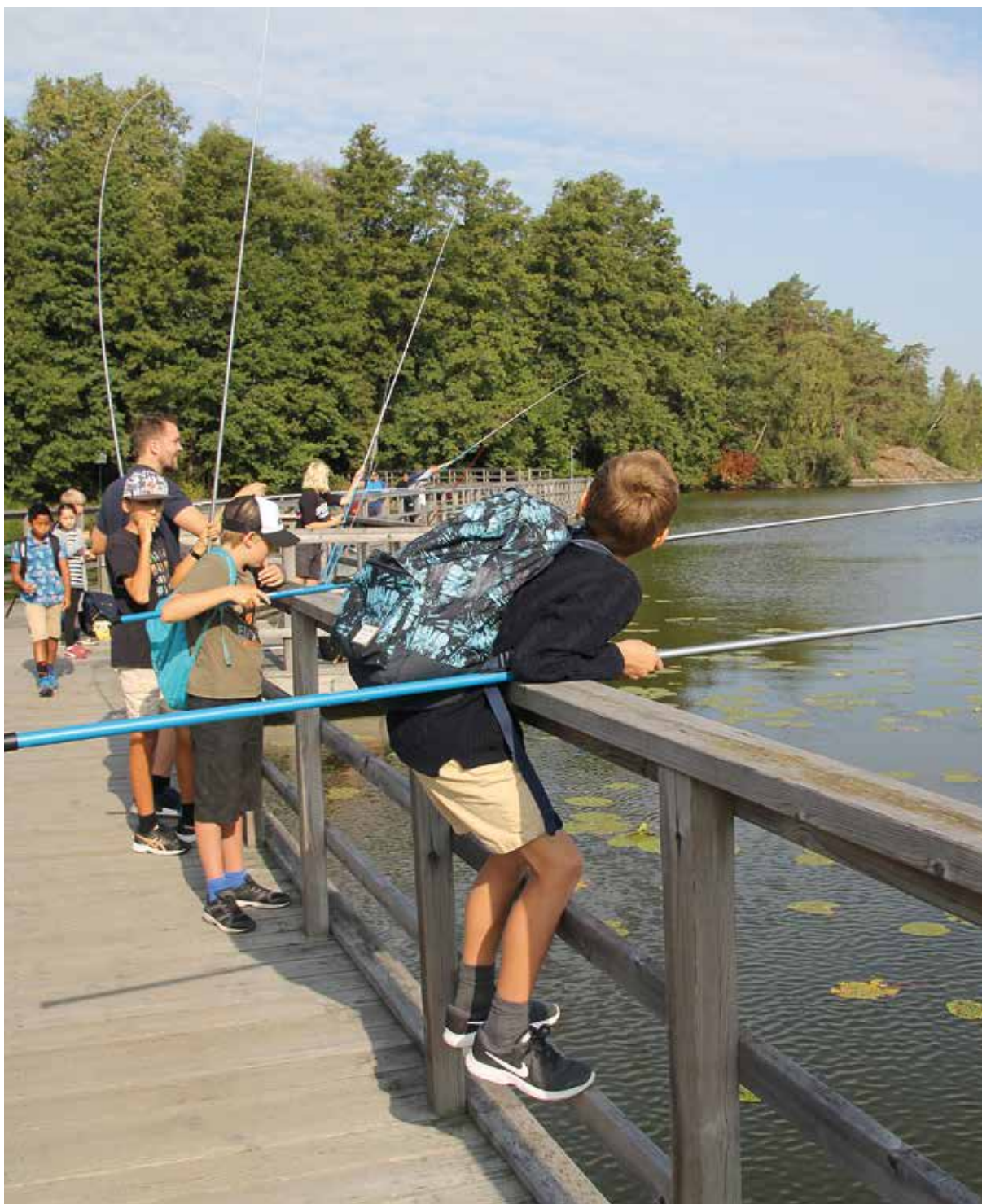
Fiske är en otroligt inkluderande aktivitet där alla kan delta med samma chanser att lyckas. Bilden är tagen från en solig fiskedag i Ältasjön utanför Stockholm.