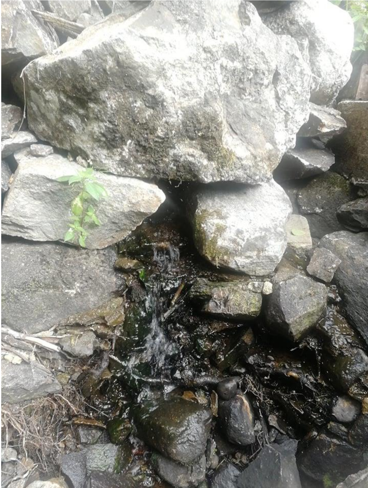
Minimalt med vatten läcker ur dammen. Annars är all tillförsel av vatten från sjöarna helt strypt.