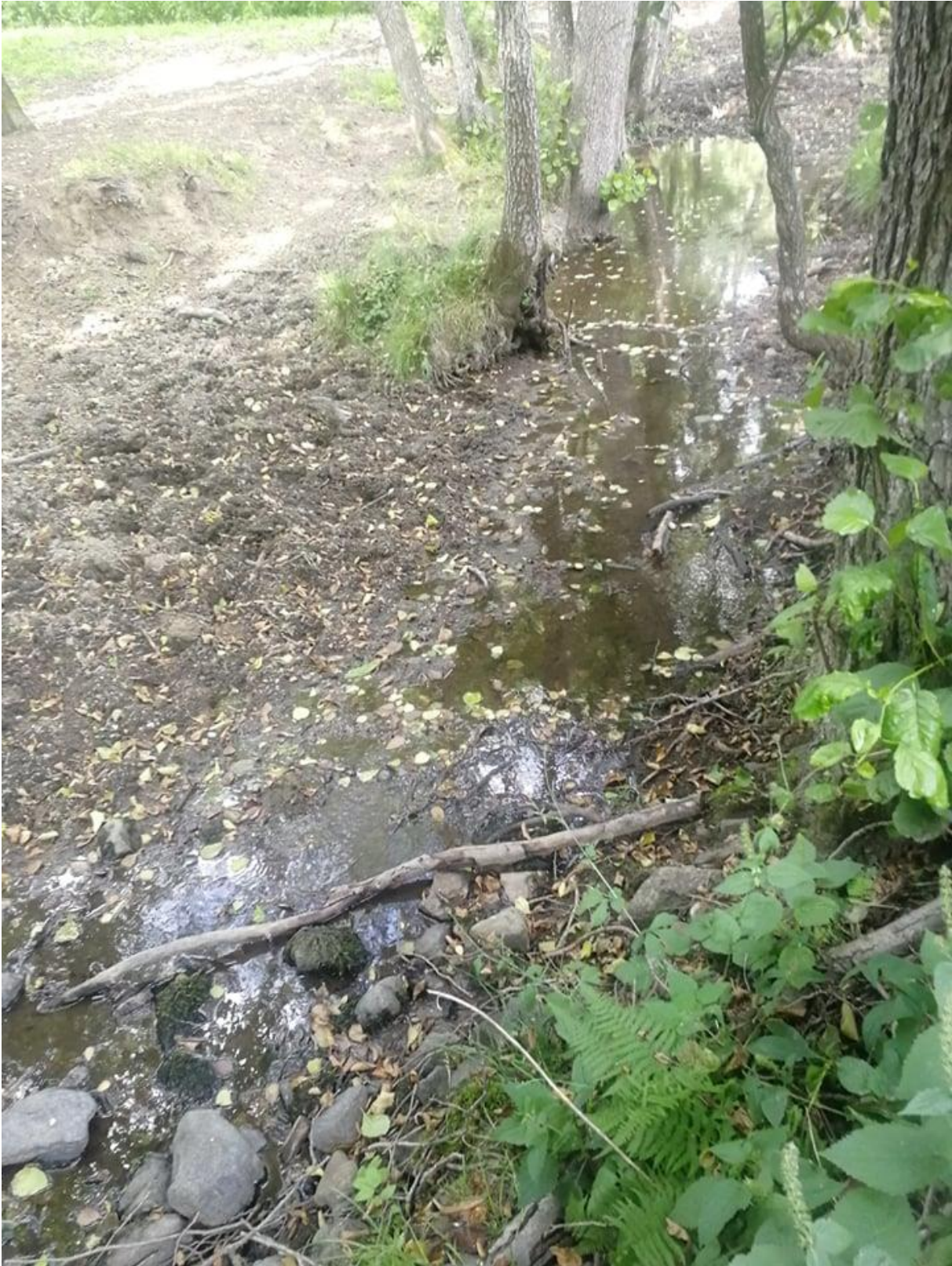
Minimalt med vatten rinner på vissa partier.