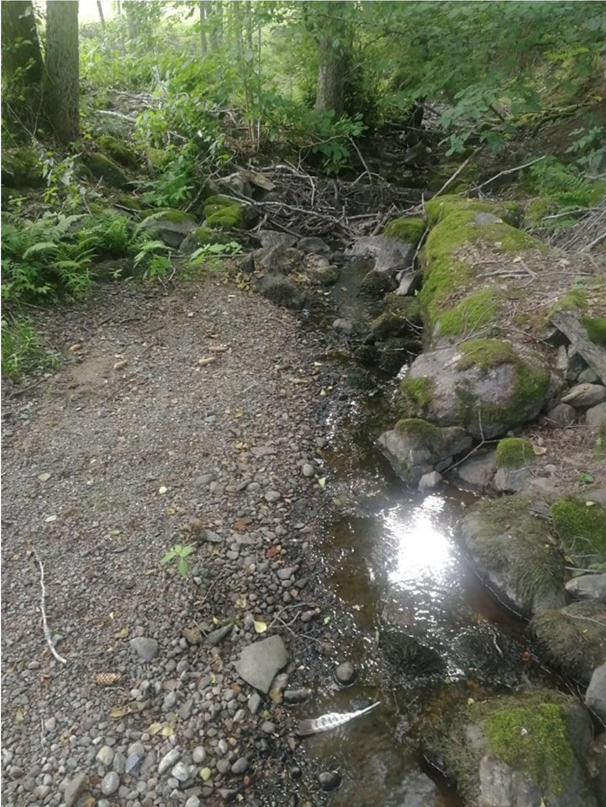
Nedan "Nedre dammen". Grusbäddar är torrlagda och å-fåran är minimal.