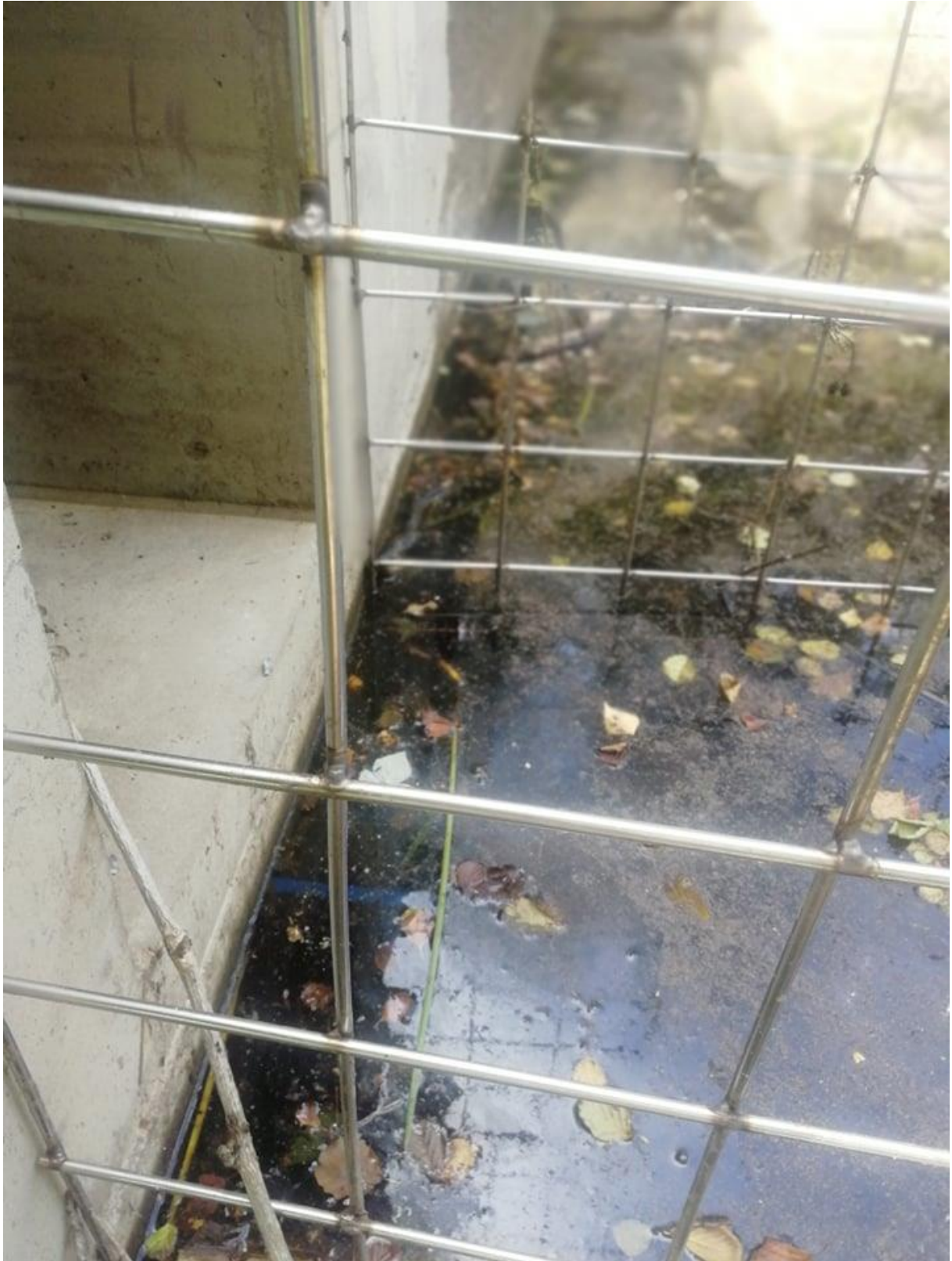
Dammutskovet vid Nedre dammen.