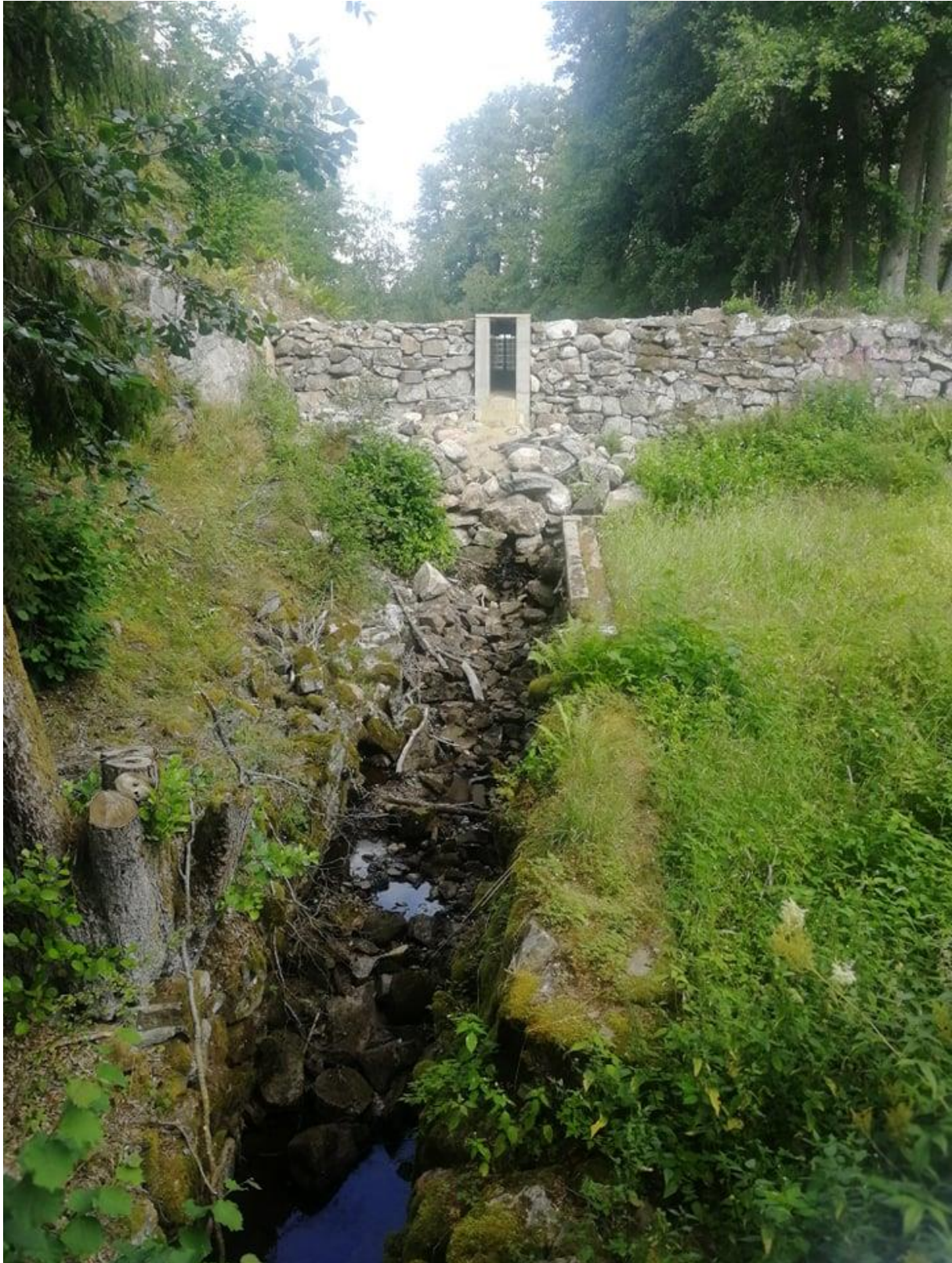
Foto taget nedan "Nedre dammen". Notera hur torrt det är och hur lite vatten som sipprar.