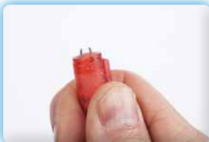
Kontakten förbättrad, enligt leverantören ska denna pirk blinka i 200 timmar.

Blinkpirk är effektivt, men inget superbete som alltid drar hugg; ekolodet visar att Landösjöns rödingar hela tiden simmar förbi utan att nappa.