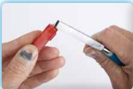
Trådkontakterna på blinkpirk fungerar bättre om trådarna böjs ihop.